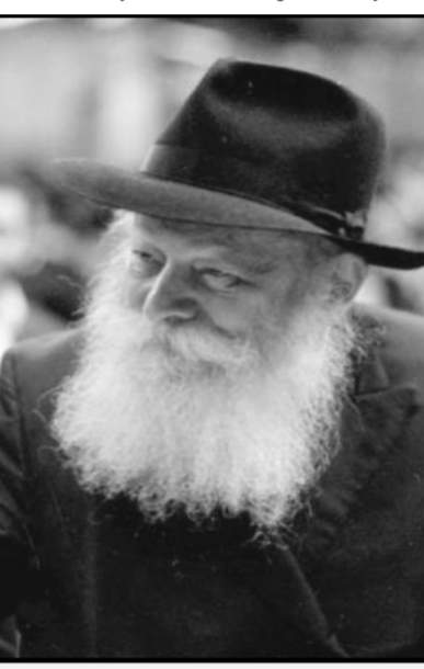
Седьмой Любавичский Ребе рабби Менахем-Мендел Шнеерсон

тестя. Так или иначе, в первую годовщину со дня ухода Ребе рабби Иосефа-Ицхока из этого мира его младший зять фактически стал новым Ребе.